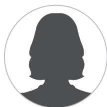
Poste vacant Chargé.e du suivi des DSP Eau

Centre Technique Intercommunal celine.contassot@ccgevrey-nuits.com 03.80.61.01.42 / 403