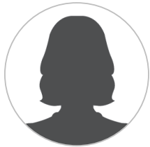
Poste vacant Responsable adjoint.e de site péri-extrascolaire Péri-extrascolaire de Noiron- sous-Gevrey

peri-extra.noiron@ccgevrey-nuits.com jerome.bourgeon@ccgevrey-nuits.com 06.19.58.12.98