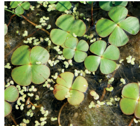
Pour transmettre des données ou les consulter : ccgevreynuits-obs.fr

La Marsilée à quatre feuilles n'est pas un trèfle mais une fougère aquatique ! On la rencontre sur les bordures des étangs, dans les eaux calmes, peu profondes et ensoleillées. En forte régression en France, protégée au niveau national, elle n'a pas été revue sur le territoire depuis les années 1990. Elle est à rechercher au bord des étangs de la Plaine. Transmettez-nous vos observations !!