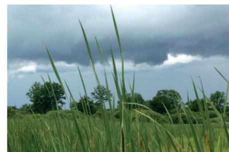
Végétation de hautes herbes bordant l'eau